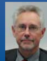
Wolfgang Witt Expansion & Immobilienverwaltung, OBI GmbH & Co. Deutschland KG